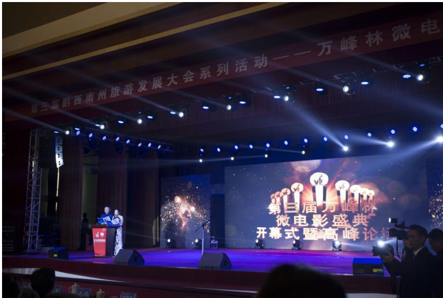
第三届“万峰林国际微电影盛典”开幕式