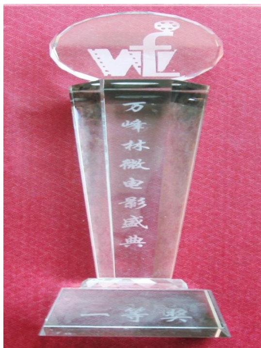
我院微电影作品《贷之罔》荣获第三届“万峰林国际微电影盛典”一等奖